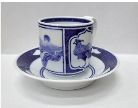
「カップアンドソーサー」(陶芸)